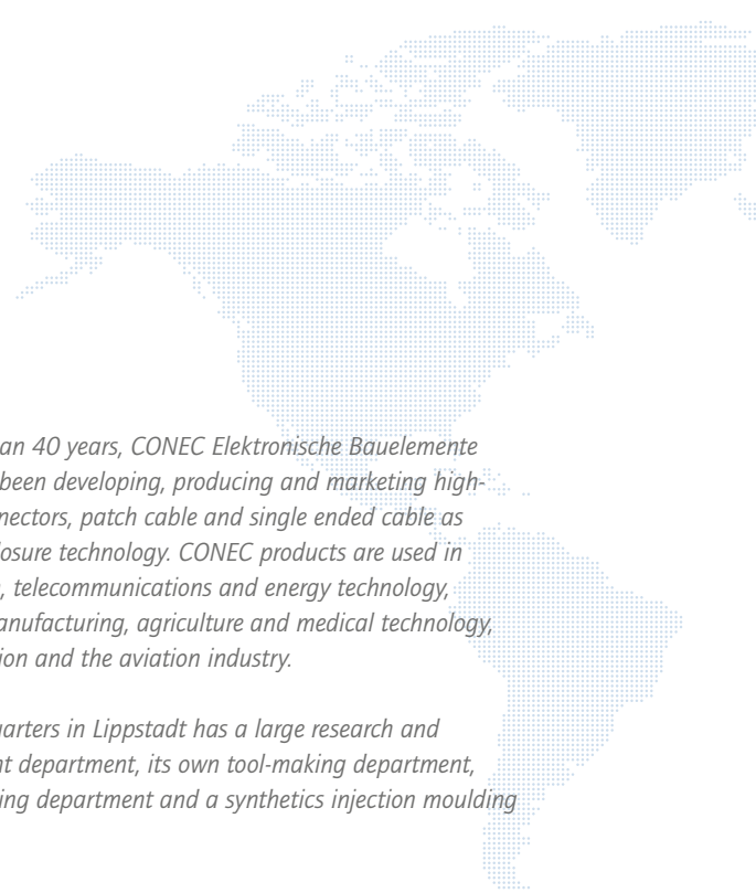
CONEC Germany, Lippstadt

As part of the Amphenol Group, CONEC participates in the growth and development opportunities of a globally active group and at the same time acts flexibly and quickly as a medium-sized company in order to optimally adapt to changing customer needs.